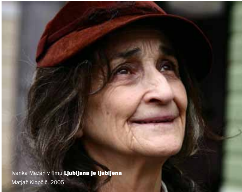
Ivanka Mežan v filmu Ljubljana je ljubljena Matjaž Klopčič, 2005